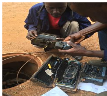
ウガンダの光ファイバーケーブル接続作業