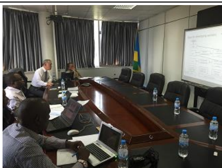
ルワンダの通信規制機関との打合せ

資格制度ニーズ確認のための現地調査及び情報整理・分析を行うとともに、資格制度導入案を作成した。